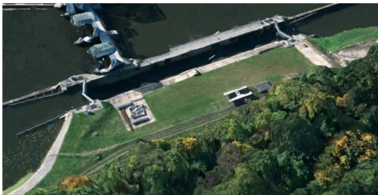
Aerofoto PK Srojnedy (z pravého břehu směrem po vodě)